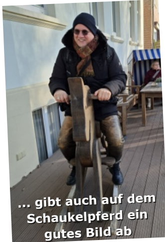
... gibt auch auf dem Schaukelpferd ein gutes Bild ab