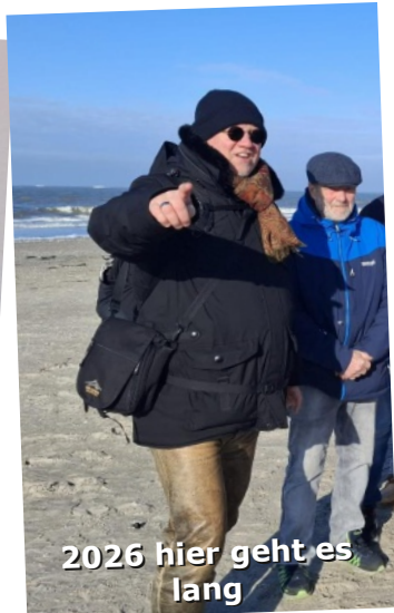
2026 hier geht es lang