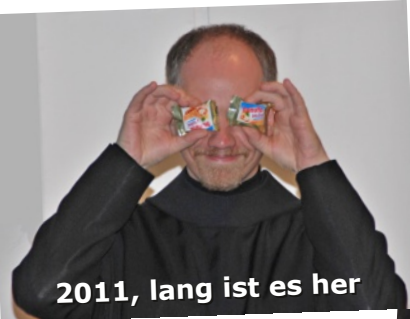
2011, lang ist es her