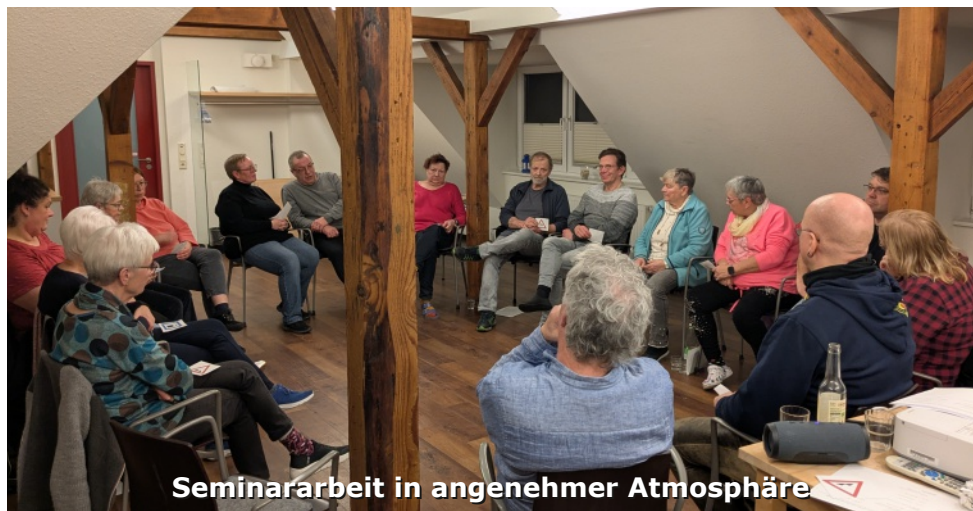
Seminararbeit in angenehmer Atmosphäre

Jede*r von uns hat sein entsprechendes Verkehrszeichen gefunden und konnte etwas dazu sagen.