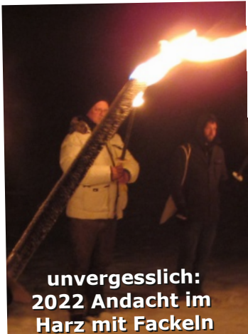
unvergesslich: 2022 Andacht im Harz mit Fackeln