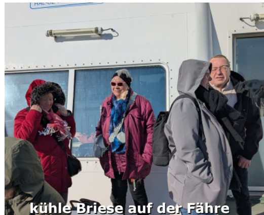
kühle Brise auf der Fähre