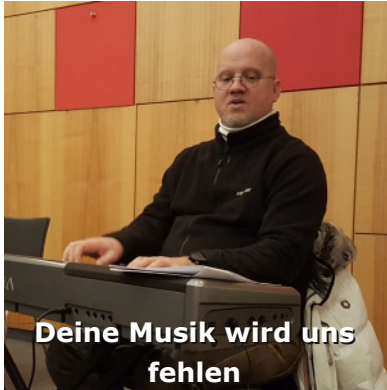
Deine Musik wird uns fehlen