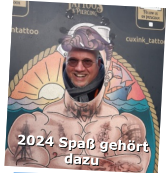
2024 Spaß gehört dazu