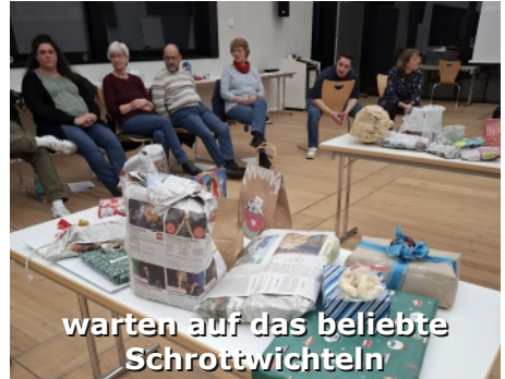
warten auf das beliebte Schrottwichteln

Einige haben sich zusammengefunden, um gemeinsam zum Weihnachtsmarkt nach Celle zu fahren.