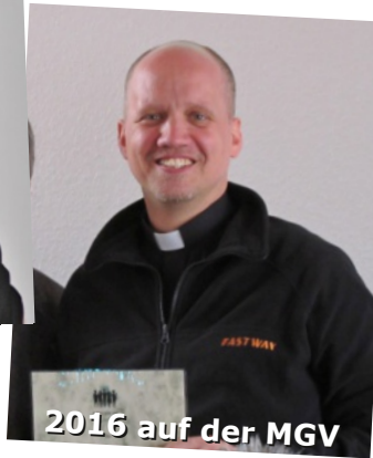
2016 auf der MGV