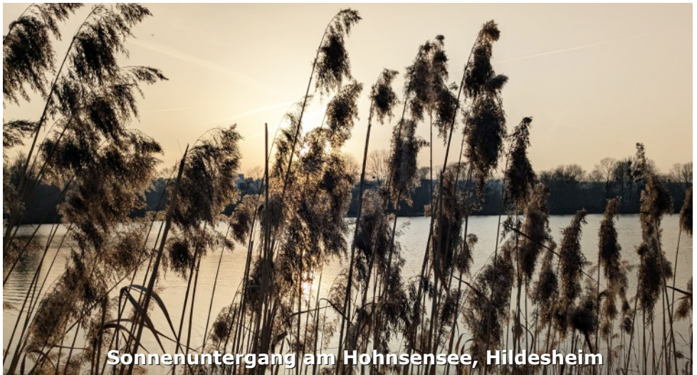
Sonnenuntergang am Hohnsensee, Hildesheim

Weitere Informationen über die Seminare entnehmen bitte dem Seminarplaner.