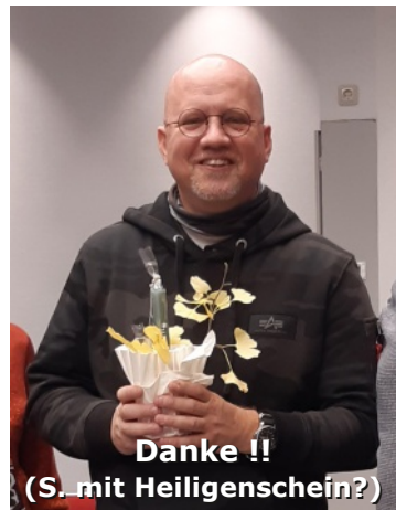
Danke !! (S. mit Heiligenschein?)