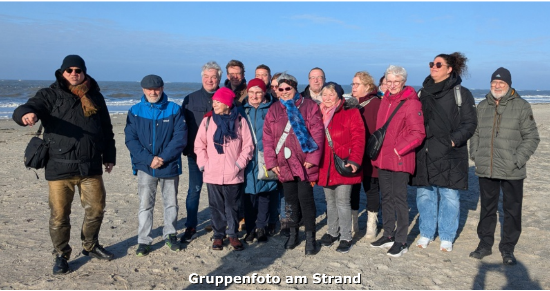
Gruppenfoto am Strand

Viel zu schnell ist das Wochenende wieder vergangen. Mit einem Lunchpaket ausgestattet, machten wir uns wieder auf den Heimweg mit der Fähre und der Bahn oder mit dem Auto. Die Rückfahrt verlief ohne Probleme.